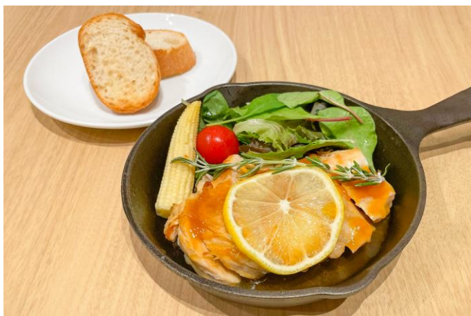
新人公演 不眠王に捧げる鶏肉のアプリコット煮