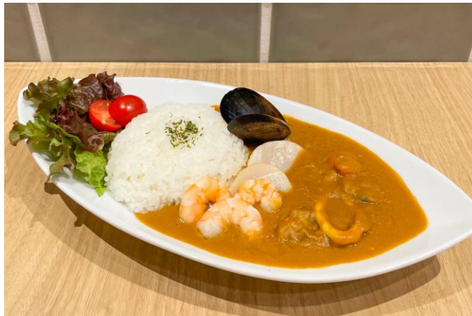
夏公演 グレートガリオン社員食堂のシーフードカレー