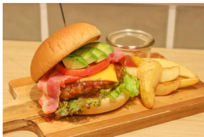
冬公演 オー・ラマ！ ハヴェンナハンバーガーセット